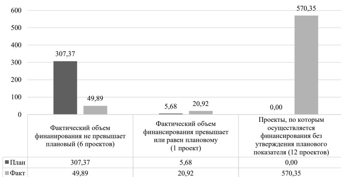
Рисунок 1 - Анализ плановых и фактических значений финансирования капитальных вложений в разрезе количества инвестиционных проектов

По итогам 3 квартала 2024 года также наблюдается перевыполнение плана по освоению капитальных вложений. Основная причина – исполнение обязательств по договорам технологического присоединения, а также включение в инвестиционную программу новых проектов. Анализ плановых и фактических освоения капитальных вложений в разрезе количества инвестиционных проектов представлен на рисунке 2.